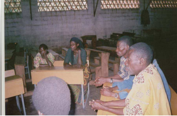
Photo n° 12 : Groupe de parole en Paroisse Mutumba ( Diocèse Bujumbura ) ; partage d'expériences traumatiques