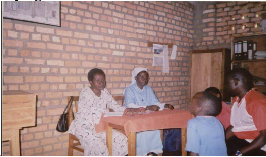
Photo n° 15 : Ecoute et soins psychiatriques à Nyabitare (Diocèse Ruyigi) par les infirmières du CEAP et du CNPK

A Muyinga, les malades mentaux sont orientés vers les cliniques semi-permanentes de TPO à Muyinga et Kirundo.