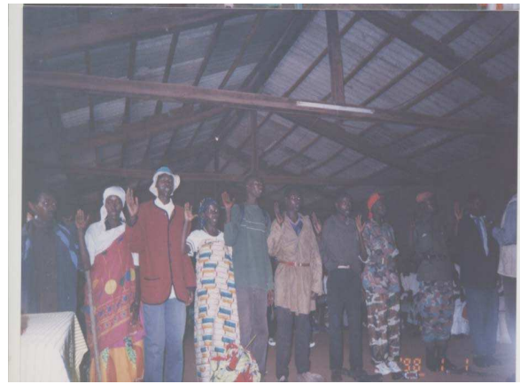
Photo n°11 : Journée culturelle à MUYINGA Jeu de rôle sur la guerre entre l'arme régulière et les rebelles ; conséquences néfastes sur la population

A la fin des cérémonies, il était prévu des prix pour les groupes les plus performants qui avaient bien joué le thème et proposé de différents moyens de guérir des blessures de guerre et d'envisager un meilleur avenir individuel et social au Burundi. Les prix étaient des non vivres, outils ménagers : cahiers, pagnes, t-shirts portant le thème, savons, jerricanes en plastic, casseroles, houes.