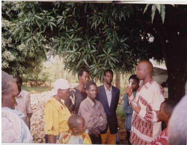
Photo n°7: Expression de la Population sur les Pyschotraumatismes consécutifs à la crise Burundaise. Rusunu (Paroisse Musongati, Diocèse Ruyigi)

La production de cette émission aide à la sensibilisation d'un plus grand public étant donné que le projet n'a pas encore atteint tous les diocèses.