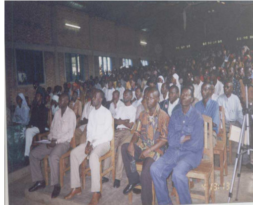
Photo n° 9 : Participant à la journée (Diocèse culturelle à Buhonga, Diocèse Bujumbura