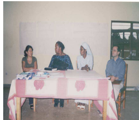
Photo N° 14 : Visite de la Représentante de CRS Burundi au personnel du PEGM en formation à Gitega