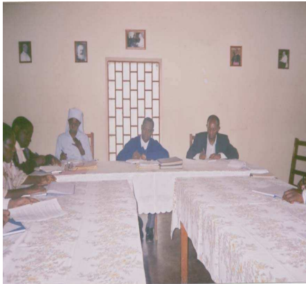
Photo n°13 : Réunion d'évaluation du PGM à Gitega : l'Evêque président de la commission, Représentant de CRS, Superviseurs et Coordinateurs

Par ces descentes, il a été constaté un besoin de renforcement des capacités de certains animateurs psychosociaux car les besoins en écoute étaient immenses contrairement à ce qu'on prévoyait au départ. Aussi, il y avait un besoin de prise en charge médicale des personnes devenues malades mentales soit à cause du traumatisme, soit à cause d'autres facteurs, sinon l'écoute et la prise en charge psychosociale devenait inefficaces. Les curés ont été contactés pour évaluer l'impact du travail d'écoute dans leur paroisse. Les animateurs peu engagés ont été remplacés.