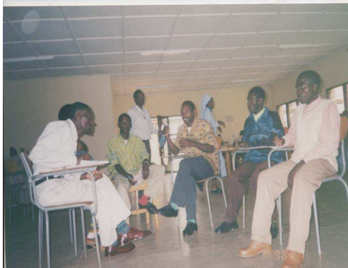
Photo n° 4 : Partage d'expériences traumatiques entre animateurs psychosociaux, pour la guérison mutuelle