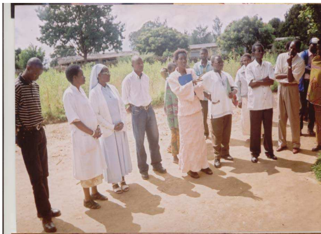
Photo n°16 : Supervision des cliniques mobiles du CNPK et du CEAP en faveur des patients du PEGM/Ruyigi par les cadres du ministère la Santé

Le département de santé mentale au ministère de La Santé a visité le projet et apprécié ses activités, surtout que le projet touche les populations à la base. La coordination du PEGM a été associée dans l'élaboration de la stratégie nationale de Santé mentale, en voie de validation et de mise en exécution, qui favorisera surtout la prise en charge communautaire et l'intégration des soins de santé mentale dans les structures de soins de santé à tous les niveaux. Cela en vue de faciliter l'accès aux soins de santé mentale.