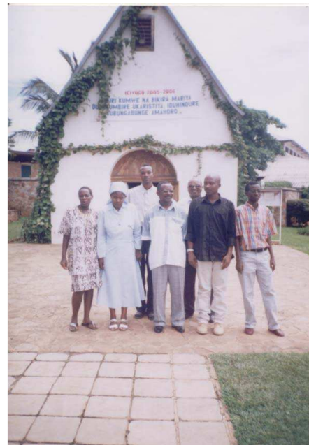
Photo n°3 : Formation des superviseurs et coordonnateurs du PEGM à Bujumbura