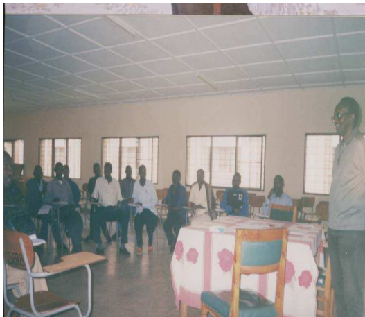
Photo n° 5 : Renforcement des capacités des animateurs psychosociaux à Gitega, sur la thérapie de groupe.