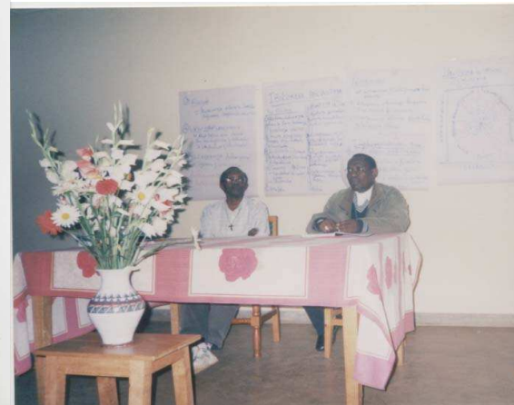
Photo n°6 : Mot de l'Evêque président de la commission « écoute et guérison des mémoires » Notre but : une société burundaise guérie et réconciliée