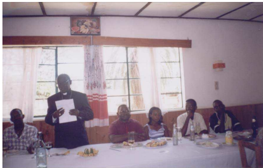
Photo n° 2 : Mot de clôture de formation Du personnel d'écoute à RUYIGI