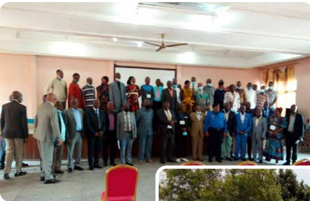
Photo de famille avec les participants de Mbuji-Mayi et de Miabi

Cette mission a permis à la CERN d'identifier ensemble avec les bénéficiaires des fonds miniers (redevance minière, cahier de charge, etc.) plusieurs défis qui nécessitent l'Accompagnement des parties prenantes des structures locales dans la gestion des fonds miniers.