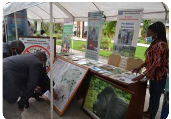
Stand d'exposition de l'ICCN