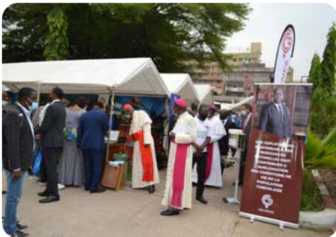
Stand d'exposition de la GECAMINES