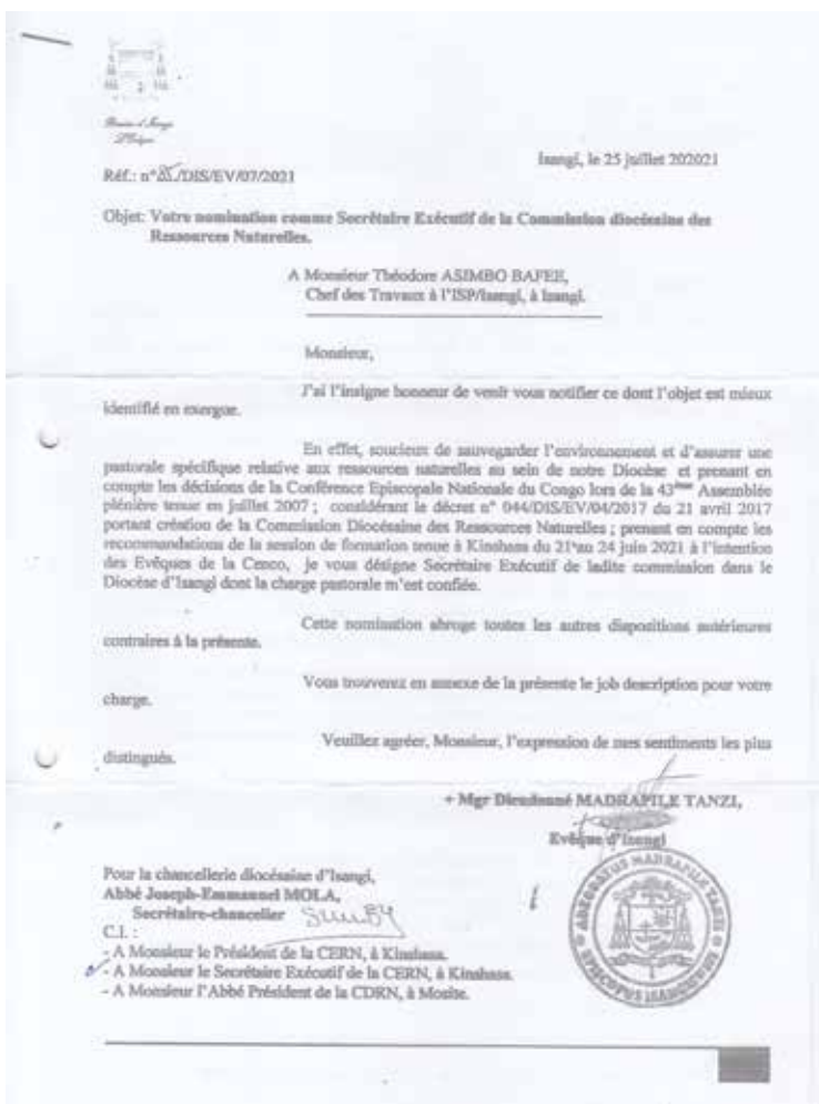
Photo : Exemple de l'Acte de nomination du Secrétaire Exécutif de la CDRN Isangi

L'application de la décision sur le déploiement de la CERN au niveau de diocèses (CDRN) et les nominations des Points focaux des diocèses dans des diocèses où il n'y avait pas d'ORN. Aujourd'hui 42 sur 47 diocèses ont des Points focaux de CDRN et chaque province ecclésiastique a un Expert qui s'occupe des questions de l'Environnement et des ressources naturelles.