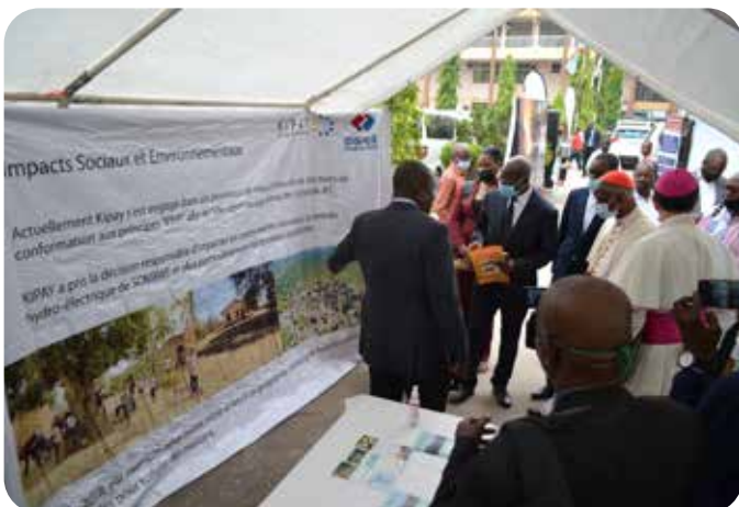
Stand d'exposition de KIPAY