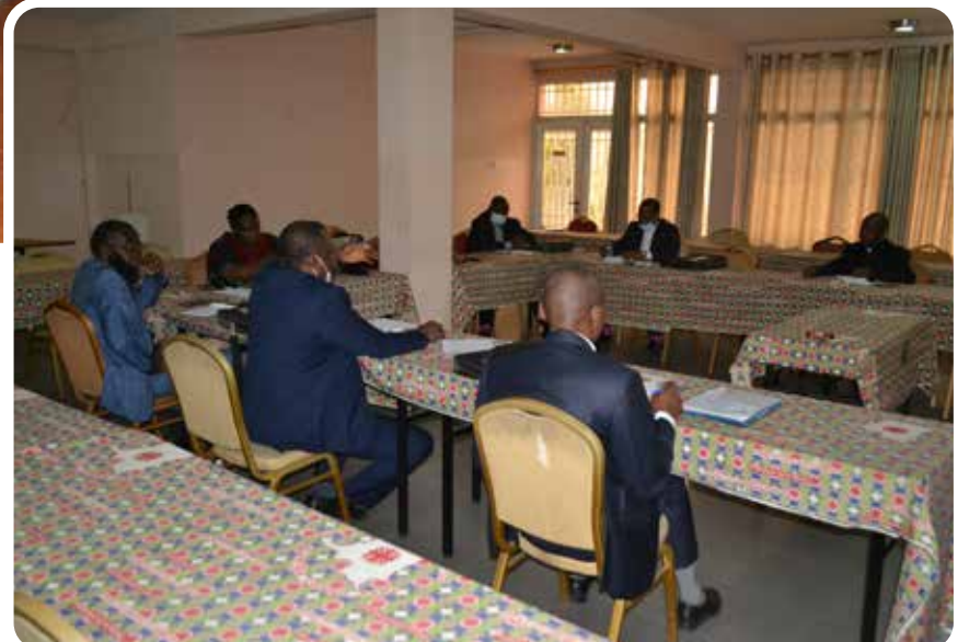
Carrefour Province Ecclésiastique de Mbandaka sur la forêt, les tourbières, la biodiversité