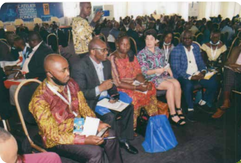
Photo : Panel 9 sur les Risques de la réalisation et la mise en œuvre de la Politique foncière.

2. Le Secrétaire Exécutif de la CERN a modéré le Panel 9 de l'atelier qui avait pour thème : « Conditions de mise en œuvre de la Politique foncière de la RDC ». Dans ce Panel, 6 points ont été traités à savoir, la vision et l'appropriation de la Politique foncière, la cohérence et l'exhaustivité du document, les animateurs de la politique, les instruments de mise en œuvre, les moyens pour la mise en œuvre et le contexte de mise en œuvre (local, national, régional, continental, international).