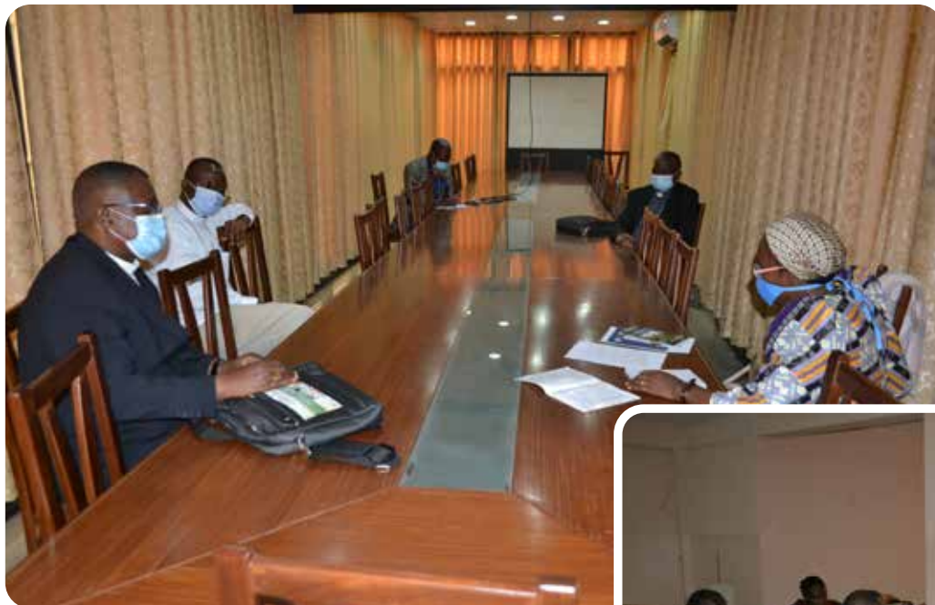
Carrefour Province Ecclésiastique de Kinshasa sur les hydrocarbures

Ces actions ont été coulées sous formes de recommandations dans le draft du message sur la position des Evêques membres de la CENCO.