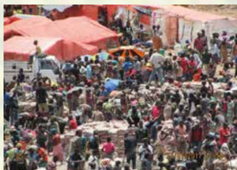
Tri du cobalt artisanal

LA VIGUEUR DES CONGOLAIS ET L'OUVERTURE HUMAINE.