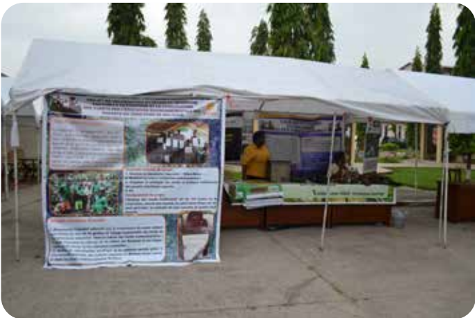
Stand d'exposition des Organisations de Peuples Autochtones Pygmées : Produits traditionnels