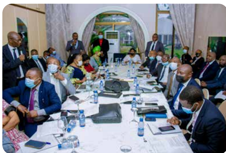
Photo : Déjeuner - débat avec les Parlementaires Africains sur les flux Financiers illicites

3. Le Secrétariat de la CERN a organisé une réunion de mise en réseau par visioconférence avec les Points focaux des CDRN et des Commissions diocésaines sœurs afin de définir des actions communes au niveau des diocèses.