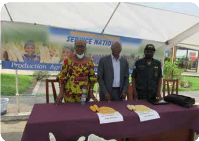
Stand d'exposition du SERVICE NATIONAL