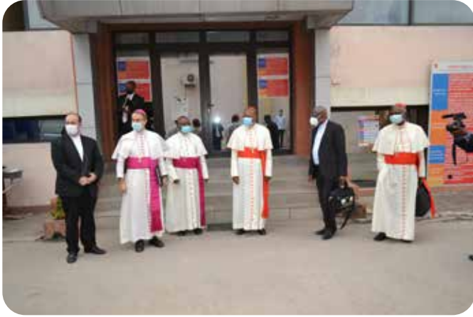
Accueil de S. Em. le Cardinal Peter K.A Turkson par l'Épiscopat Congolais.