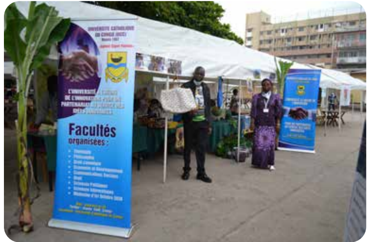
Stand d'exposition de l'UCC/ Faculté Economie et Développement