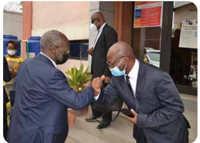
Accueil du Président de la FEC-RDC par le Secrétaire Exécutif de la CERN