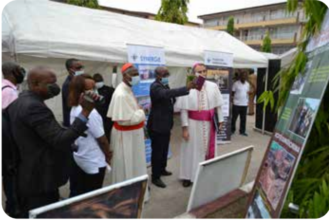
Stand d'exposition de la CERN CENCO