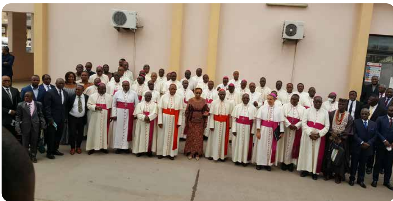
Photo des participants à la première journée avec la Vice-Premier Ministre, Ministre de l'Environnement et Développement durable;