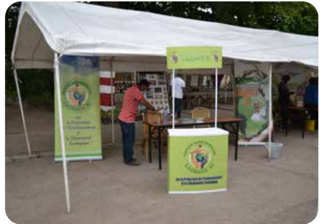
Stand d'exposition du CENTRE MISSIONNAIRE LAUDATO SI', mccj