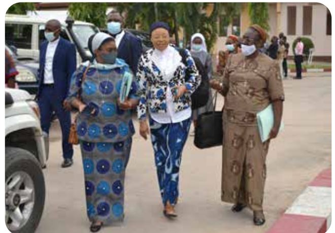
Arrivée de membres des commissions et structures de la CENCO