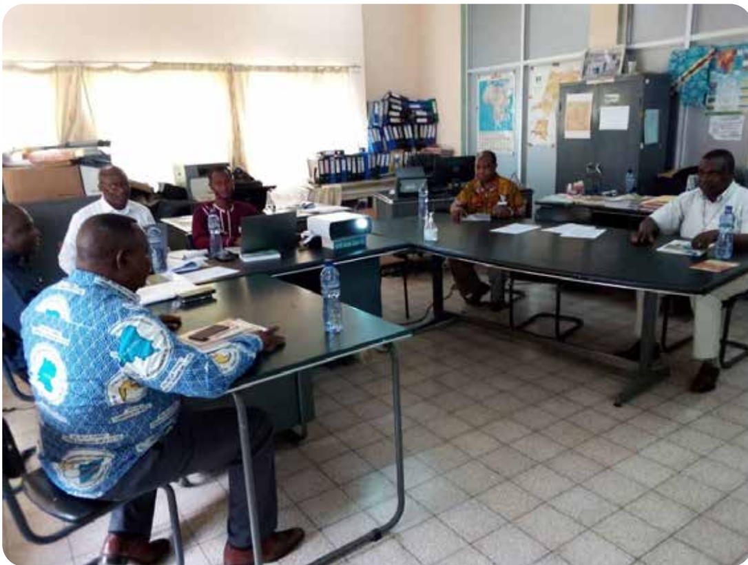
Reunion inter-commission sur la finalisation du message de CENCO sur les ressources naturelles et l'environnement

Un message définissant l'engagement des parties prenantes (Eglise, Gouvernement, population, entreprises, etc.) aux différents niveaux de prise de décision dans le secteur des ressources naturelles. Lors de la session extraordinaire du Comité permanent des Evêques du 23 au 25 novembre 2021, le draft du message contenant l'analyse de chaque partie prenante dans la prise de décisions et l'action a reçu les orientations des Evêques pour finalisation et diffusion. Dans ce message les Evêques ont traduit clairement leur engagement dans la Pastorale de l'environnement et des ressources naturelles pour la protection du Bassin du Congo.