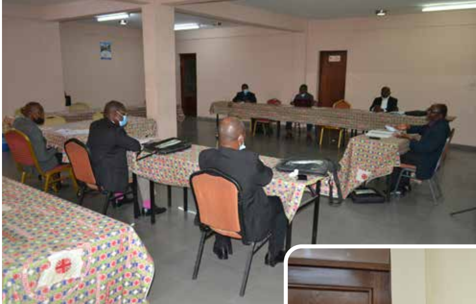
Carrefour Province Ecclésiastique de Lubumbashi sur les Mines