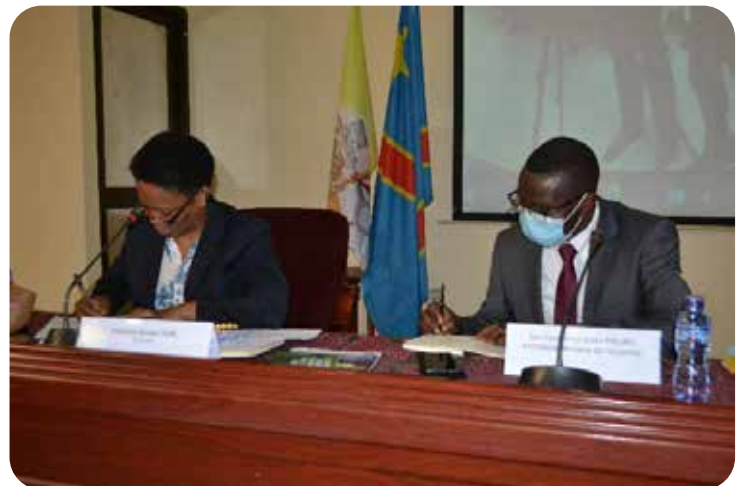
Photo des intervenants