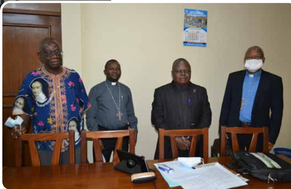
Carrefour Province Ecclésiastique de Kananga sur l'Energie