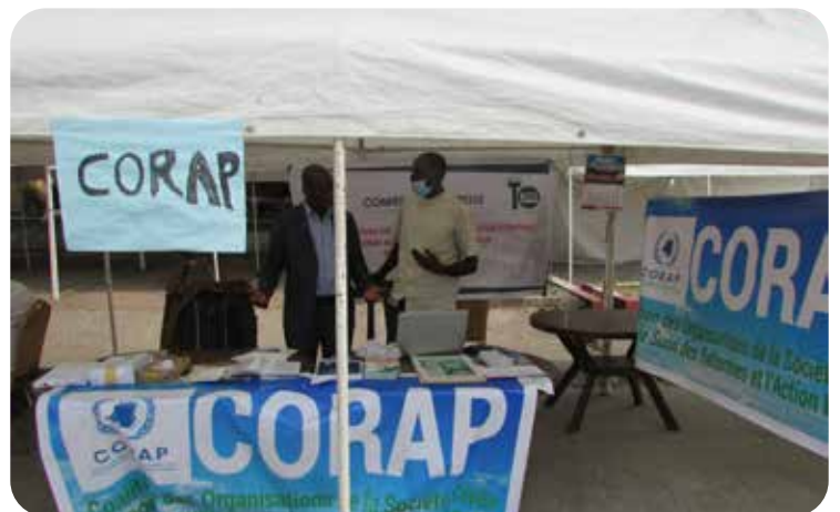
Stand d'exposition de la CORAP