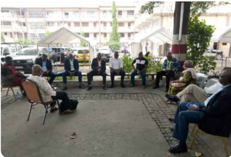
Réunion avec les Secrétaires et les Expert des Assemblées Episcopales provinciales