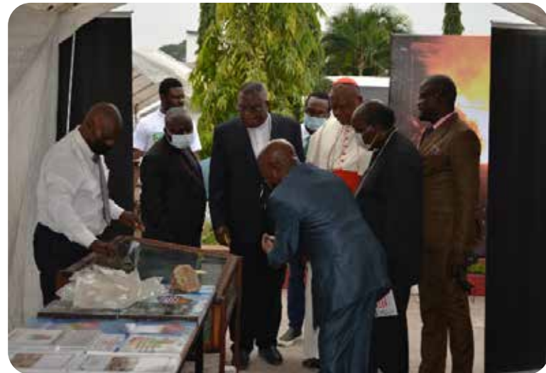
De gauche à droite : Stand de l'Université Catholique du Congo (Faculté Economie et Développement) et Stand de la Cellule Technique pour la Coordination et Planification Minière (CTCPM).