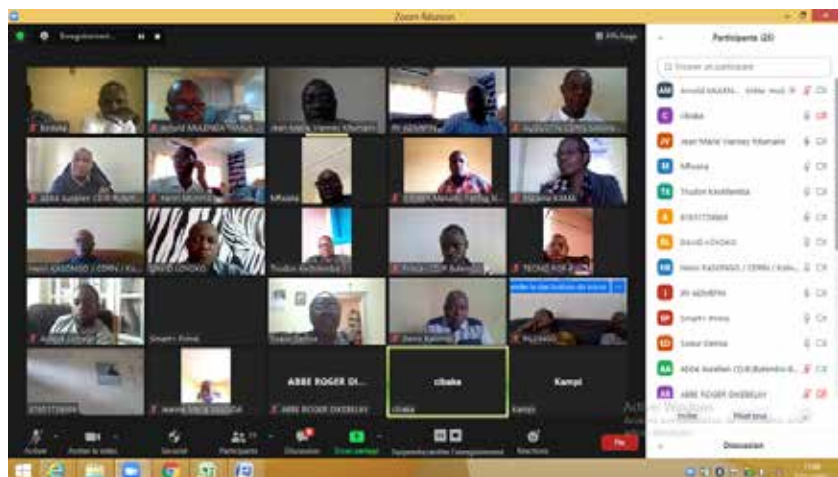
Photo de la réunion zoom de mise en réseau