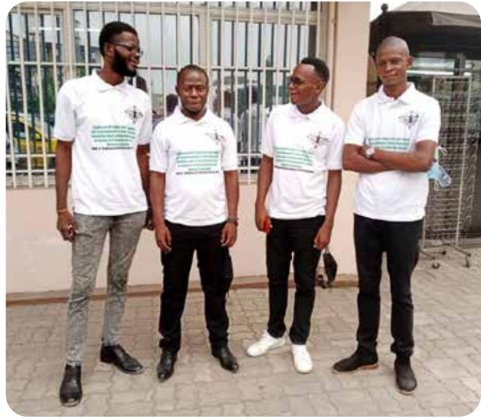
Equipe protocole session des Exêques