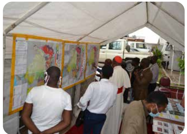
Stand d'exposition de la CTCPM/Ministère de Mines