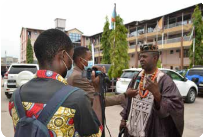
Interview de S.M. MFUMU DIFIMA, Représentant de l'Autorité Coutumière de la RDC