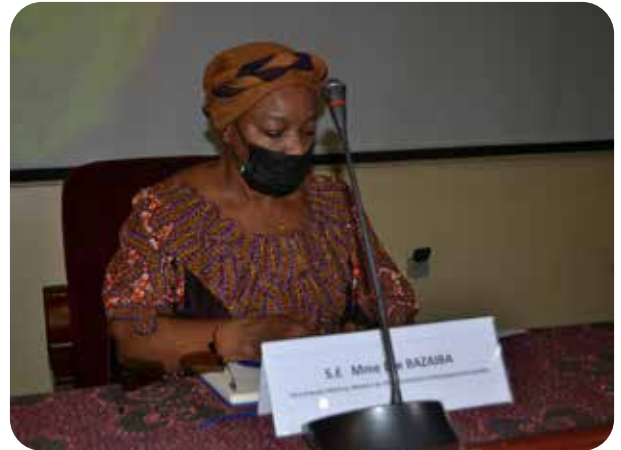
Son Excellence Madame Eve BAZAIBA, Vice-Premier Ministre, Ministre de l'Environnement et Développement durable, RDC