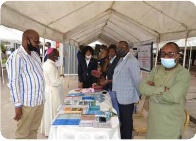
Stand d'exposition de l'Université William Booth/ Faculté de Médecine