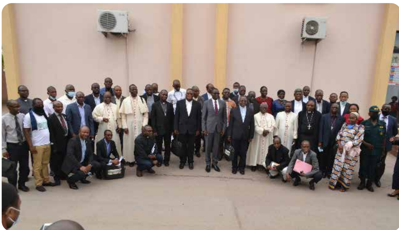
Photo des participants à la quatrième journée avec le Ministre National de l'Industrie.