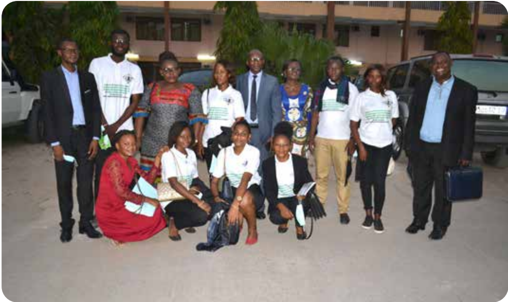
Equipe organisateur de la session