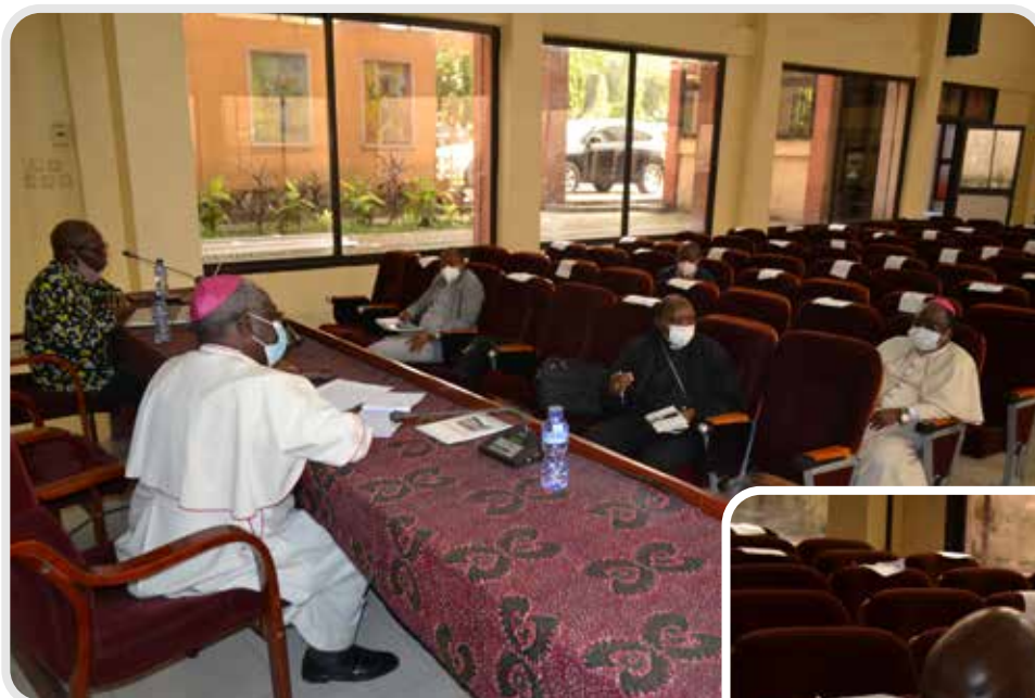
Carrefour Province Ecclésiastique de Bukavu sur la Terre