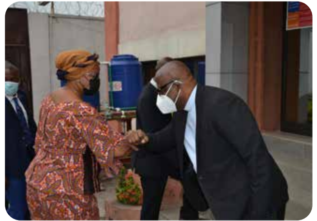
Accueil de Son Excellence Madame Eve BAZAIBA, Vice-Premier Ministre, Ministre de l'Environnement et Développement durable par le Secrétaire Général de la CENCO