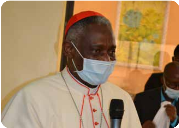
Son Eminence le Cardinal Peter K.A. Turkson, Préfet du Dicastère pour le Service du Développement Humain Intégral