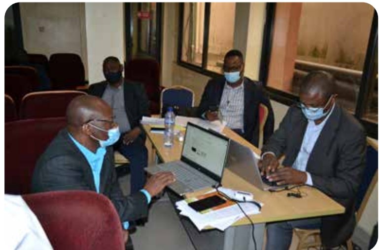
Membres du Secrétariat scientifique