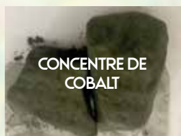
CONCENTRE DE COBALT

MINERALS USEFUL FOR ENERGY TRANSITION : 60 % OF WORLD COBALT, 34 % OF WORLD COLTAN, 10 % OF WORLD COPPER, LITHIUM, GERMANIUM AND RARE EARTHS, ETC.