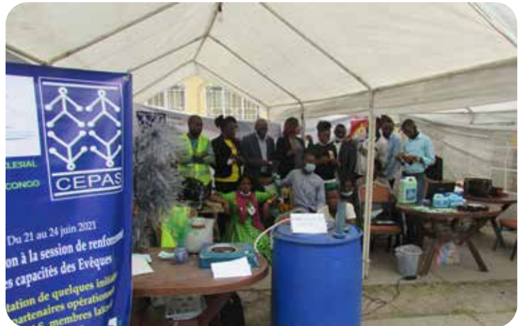
Stand d'exposition des Organisations membres du CEPAS /REBAC