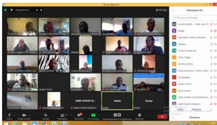
Photo de la réunion de mise en réseau du 27 novembre 2021.

3. Le Secrétariat de la CERN a organisé une réunion de mise en réseau par visioconférence avec les Points focaux des CDRN et des Commissions diocésaines sœurs afin de définir des actions communes au niveau des diocèses.