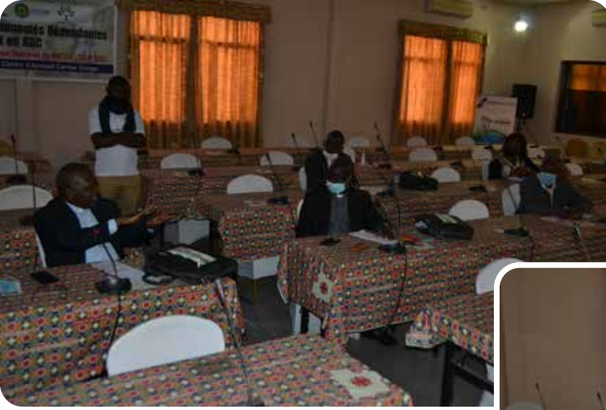
Carrefour Province Ecclésiastique de Kisangani sur l'Eau